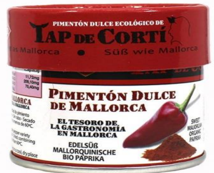
Código 21155 SALERO PIMENTON TAP DE CORTI (ECO) 30G