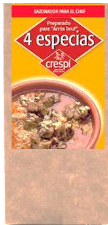
Código 21616 CUATRO ESPECIAS ECO 35 G