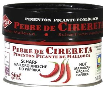
Código 21156 SALERO PIMENTON PICANTE CIRERETE (ECO) 30 G