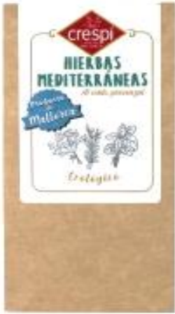
Código 21722 ESPECIAS HIERBAS MEDITERRANÉAS