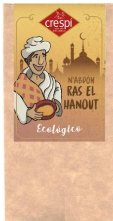
Código 21723 RAS EL HANOUT ECO 4X5 G.