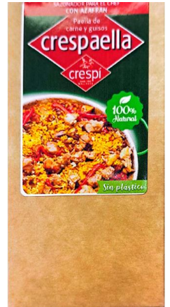
Código 21124 CRESPAELLA CARNE ECO 4X5 G