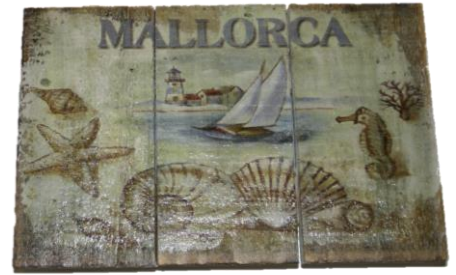
Código 25150 - B Colgador Madera Marinero Ref.10539 20 UDS