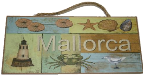
Código 25151 - B Colgador Madera Faros Marinos Ref.10560 6 UDS