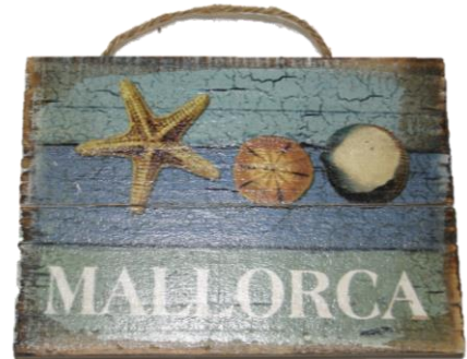
Código 25148 - B Colgador Madera Estrella Ref.10541 32 UDS