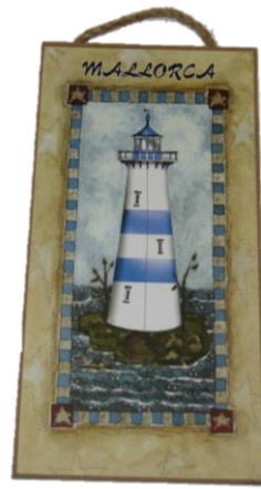
Código 25154 - B Colgador Madera Faro Ref.10557 14 UDS