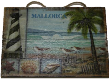
Código 25153 - B Colgador Madera Faro Palmera Ref.10538 9 UDS