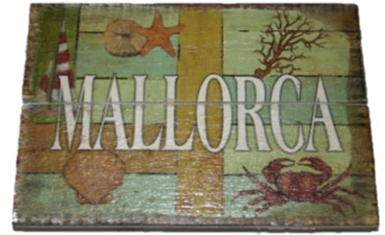
Código 25155 - B Colgador Madera Faro Palmera Ref.10540 1 UDS